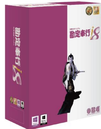
協立情報通信は、OBC パートナー・アワード 2013-2014 最優秀賞を受賞しております